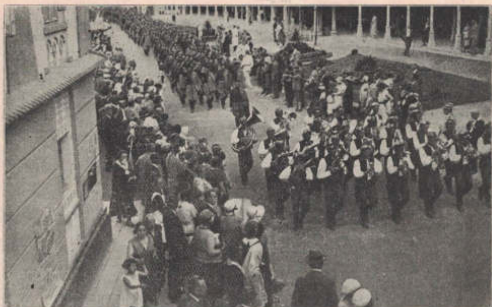
Slet župy Komenského v Luhačovicích: Ukázka z průvodu.