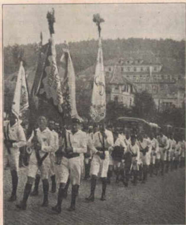
Slet župy Komenského v Luhačovicích; Dorostenci v průvodu.