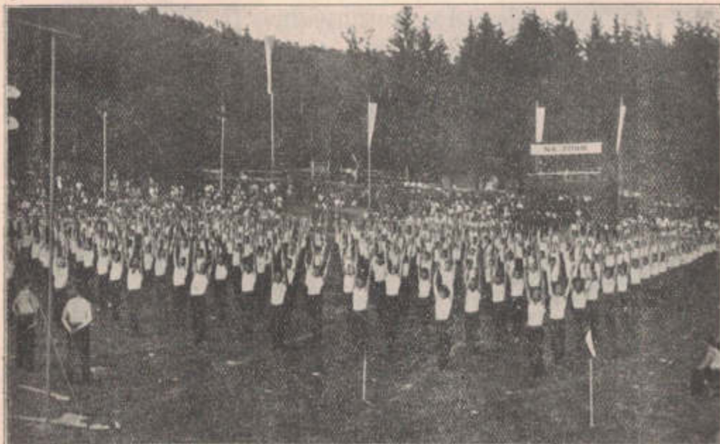
Slet župy Komenského v Luhačovicích: Prostná mužů.