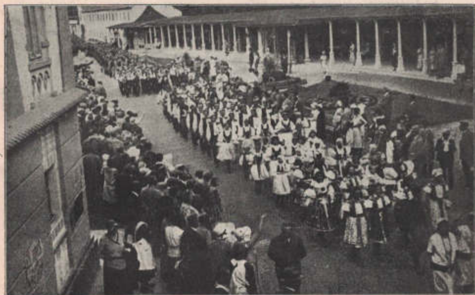
Slet župy Komenského v Luhačovicích: Ukázka z průvodu.